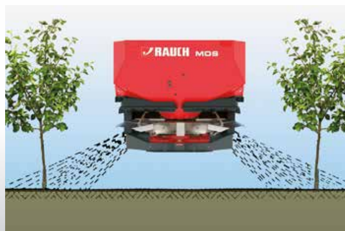
Modo de acción del dispositivo de dispersión en filas RV 2M

El dispositivo de distribución en filas RV 2M permite una aplicación dirigida de abono en el área de las raíces de cultivos en filas. De esta manera, no caen granulados en el carril, lo que permite ahorrar abono y conlleva un menor impacto medioambiental. RV 2M permite ajustar de forma sencilla y variable las distancias entre filas entre 2 y 5 m.