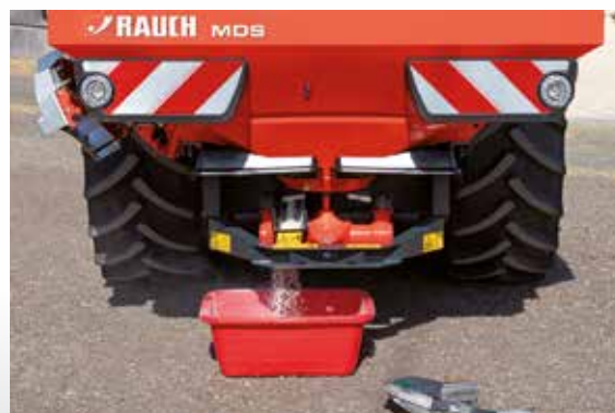
Prueba de expulsión