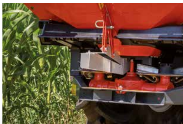
GSE 7, distribución en lindes desde el límite del campo