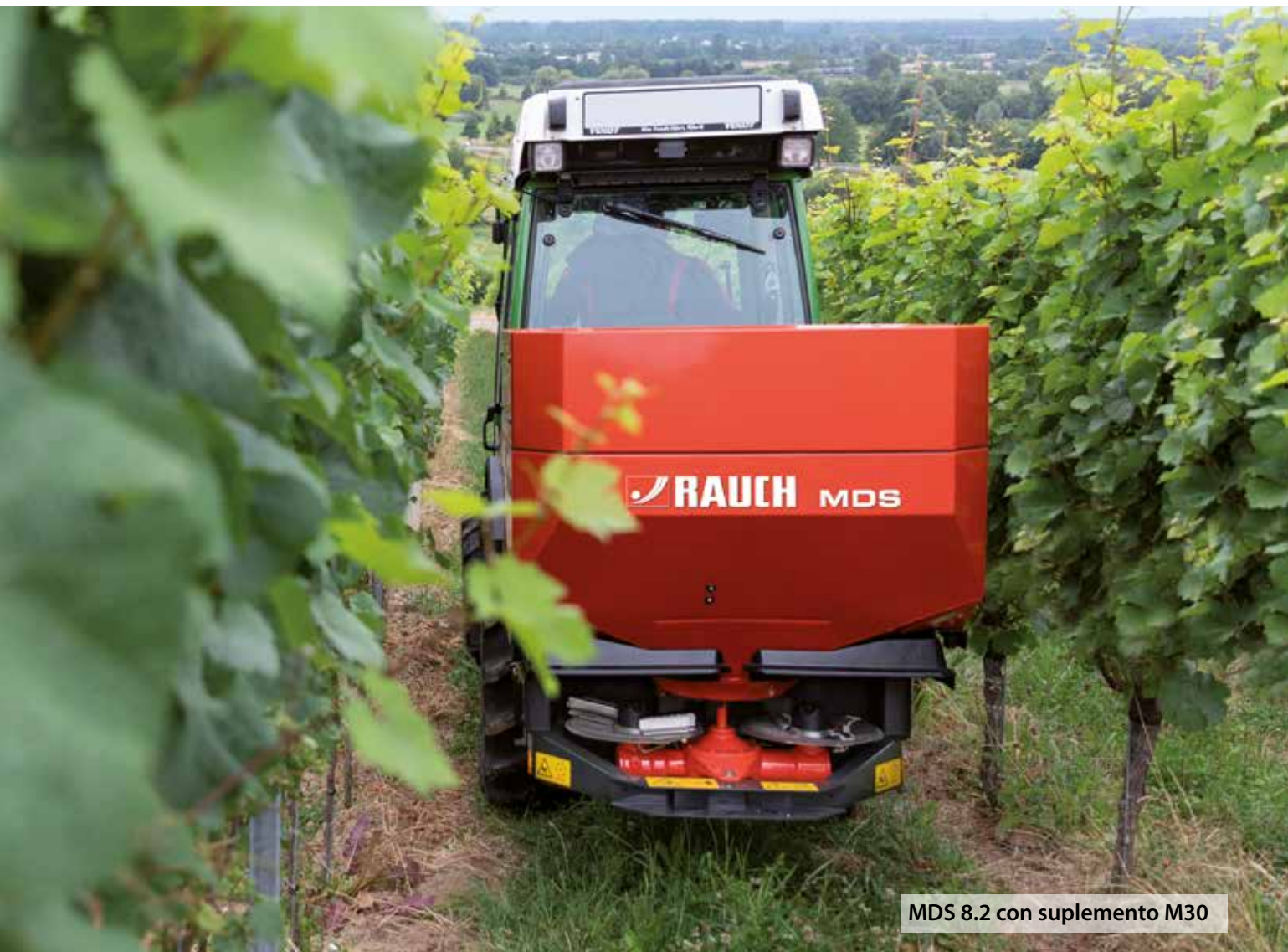
MDS 8.2 con suplemento M30

Las abonadoras MDS resultan imprescindibles para el uso profesional en cultivos de frutas, viñedos y de lúpulo y están perfectamente preparadas para ello con innovadoras soluciones.