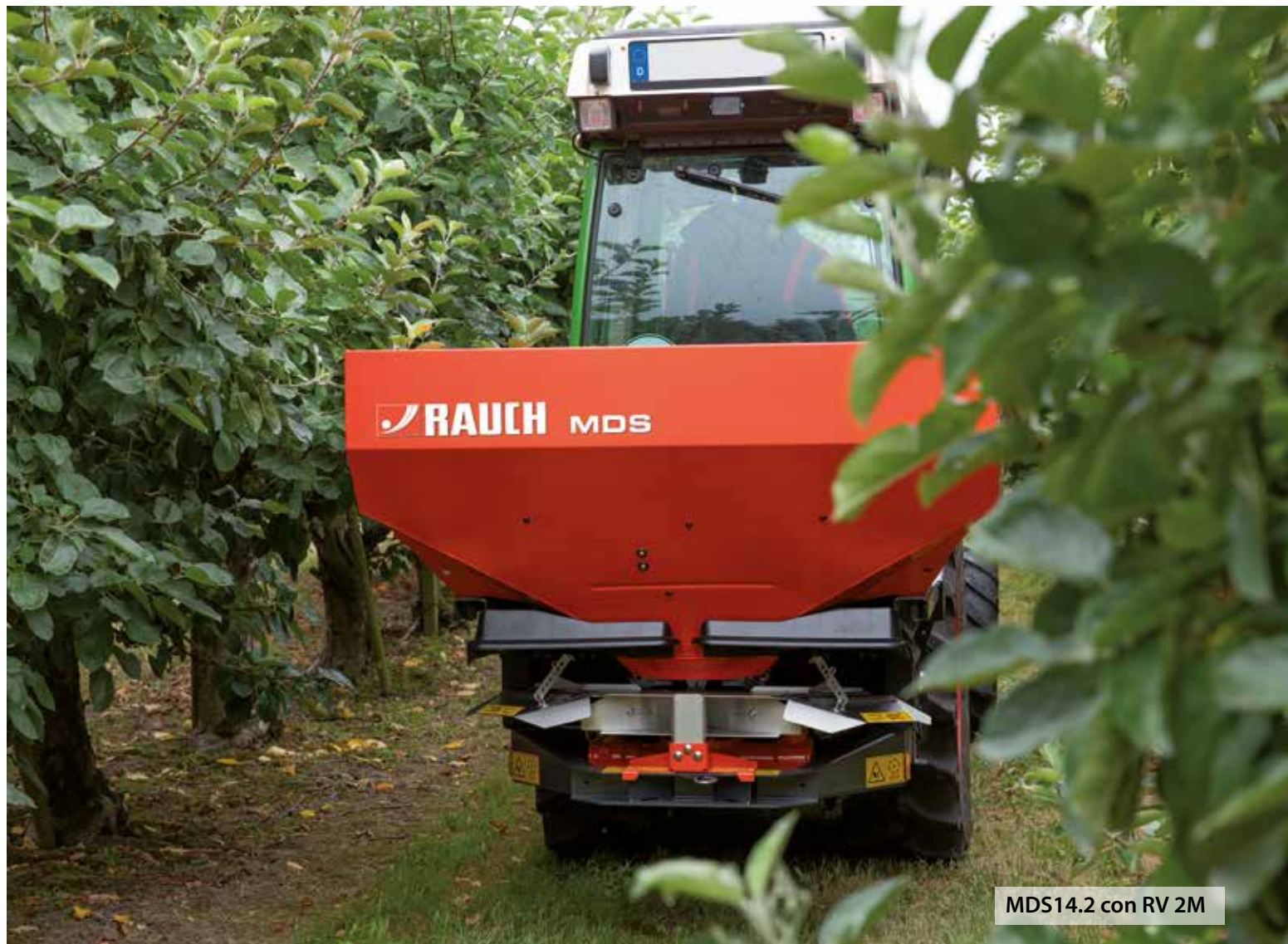
MDS14.2 con RV 2M