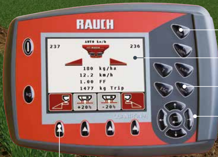
Funciones VariSpread a izquierda/ derecha