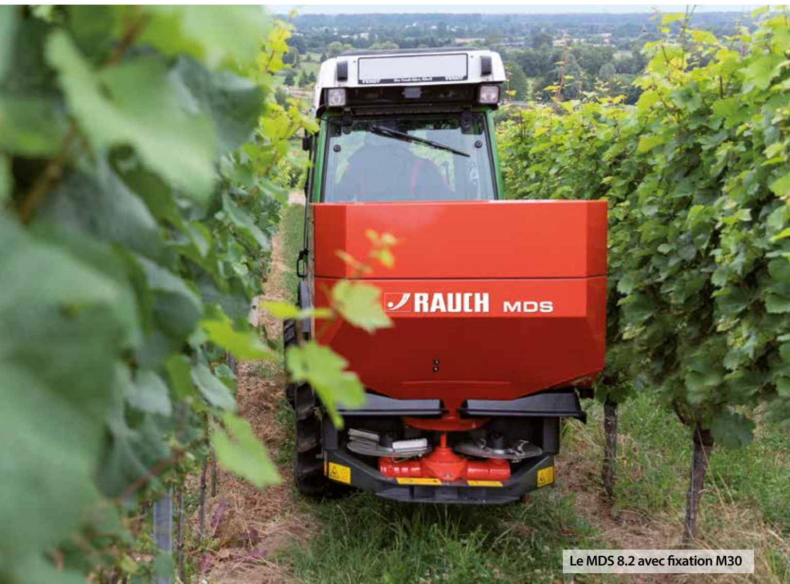
Le MDS 8.2 avec fixation M30

Les épandeurs MDS sont indispensables pour une utilisation professionnelle dans la culture des fruits, de la vigne ou du houblon et sont parfaitement préparés à cette tâche grâce à des solutions innovantes et détaillées.