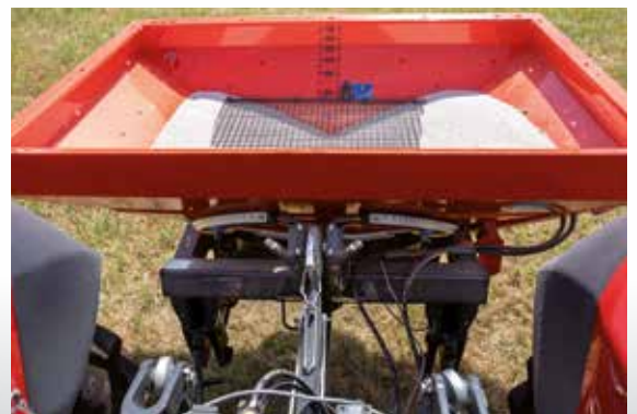
Système à une chambre

Le système à une chambre permet une construction très compacte. Ceci permet une fertilisation efficace même avec un petit tracteur.