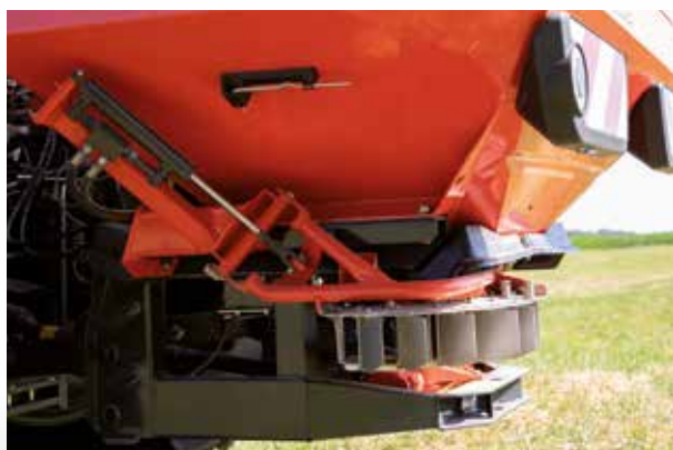
TELIMAT, l'épandage en limite depuis le jalonnage

Le GSE 7 est un dispositif d'épandage en limite et en bordure à commande manuelle qui permet un épandage unilatéral (à gauche ou à droite) à arêtes vives directement depuis la limite du champ. L'équipement peut être commandé à distance sur demande et peut également être combiné avec TELIMAT.