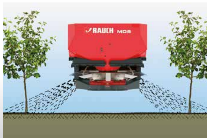
Montage du dispositif d'épandage à rangs RV 2M

Le dispositif d'épandage sur 2 rangs RV 2M permet la fertilisation ciblée au niveau des racines de plantations en rangées. Aucun granulé ne tombe dans la trace du tracteur. Cela permet d'économiser de l'engrais précieux et d'alléger la charge sur l'environnement. L'équipement RV 2M se règle facilement et de façon variable sur des écarts de 2 à 5 m entre les rangées.