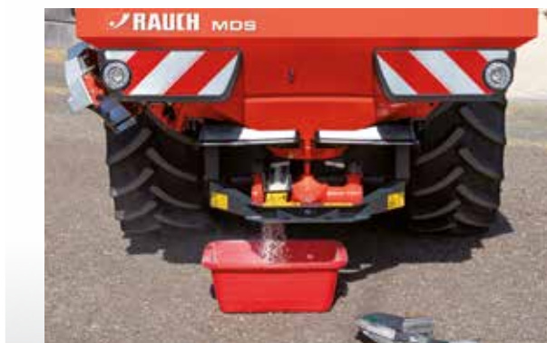
Contrôle de débit

Tous les modèles MDS sont également adaptés à la nutrition des plantes en agriculture biologique. RAUCH propose des tableaux d'épandage pour les engrais agréés ainsi que pour les engrais organiques sous forme de granulés ou de pellets.