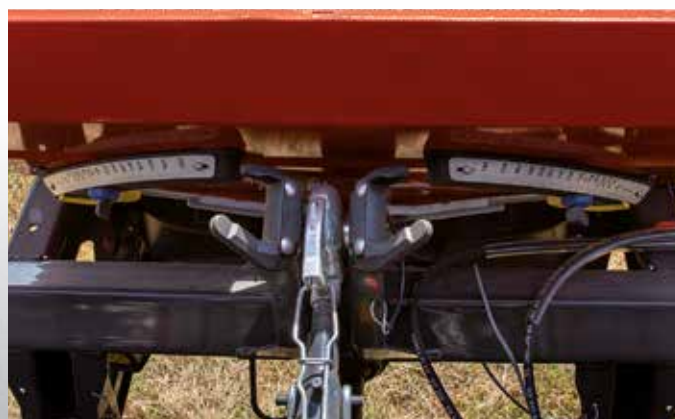
Échelles DfC facilement visibles

La position des clapets, en particulier, peut être vérifiée à l'aide de l'aiguille jaune avec vue depuis la cabine du tracteur. Cela signifie qu'il n'est pas nécessaire de sortir.